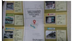
作成地図の パンフレット 完成

今月は、ホームカミングデーなどで頂いたご意見を参考に学内地図の修正・補正を行いました。また、学校の印刷は白黒が多いということだったので、白黒でも地図が機能するかの確認をしました。さらに、並行して表紙の作成もすすめ、パンフレットという紙媒体に印刷できる状態まで完成させることができました。また、印刷したパンフレットを広報室に置かせてほしいということと、広報の学内案内に利用してもらえないかということに関しての交渉を行いました。完成したパンフレットは、完成品が届き次第、図書館や保健管理センターなどにも置かせてもらえるよう交渉する予定です。