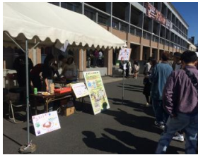
姫山祭にて 活動紹介

姫山祭にてパンケーキ販売ブースの横で展示や紹介を行いました。店先に当会の活動をまとめたポスターなどを設置しました。パンケーキを待つ間にポスターやねこ台帳を見ていただき、時には声かけをして活動の紹介を行いました。学生を始め、学外の多くの方々の反響をいただき、本活動および学内のねこに興味がある方が多くいらっしゃると感じることができました。11月下旬には山口市の地域猫を担当する環境衛生課に訪問し、地域猫の避妊手術における助成に関した相談をさせていただきました。団体登録に関すること、助成金に関することなど様々なことに答えていただき、今後の活動方針を会員内で統一していく必要があると認識しました。