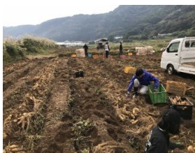
鹿児島にて サツマイモ収穫 交流

11月25日に焼酎醸造用サツマイモの収穫作業を鹿児島大学と共同で行いました。山口大学からは2名の学生、鹿児島大学からは10名程度の学生とで行いました。山口大学の学生は今までサツマイモの収穫作業を行ったことが無く今回の収穫作業が初めての体験となりました。鹿児島大学の学生に指導を受けながら用務を実施しました。焼酎醸造用のサツマイモは黄金千貫という品種で白色をした食用よりも大きいサツマイモを収穫しました。11月26日は日本酒と焼酎に関する情報交換会を行いました。山口大学からは酒米の栽培を中心に発表や意見交換を行いました。鹿児島大学からは、焼酎用の栽培方法を中心に省力化された栽培の発表が行われ、質問等で情報共有を行いました。薩長同盟酒用の栽培についても意見交換が行われ、今年の倒伏の程度が大きかった要因についても話し合いました。今年、鹿児島県に毎週のように台風が直撃した自然要因も要因であり、鹿児島県での酒米の栽培が難しいという結論に至りました。