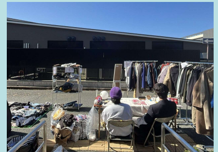
姫山祭フリーマーケット

今月は前々から準備を重ねていた山口大学姫山祭にフリーマーケットの出展をしました。天候にも恵まれ、多くの方に足を運んでいただきました。そして、実際に商品を手に取り、購入していただくことができました。自分達の活動に興味を持ってくれた方も多く、この活動に至った経緯や活動の目的等を話す機会も多くありました。ご来店いただいた方はもちろん、この活動にご助力をいただいた全ての方、本当にありがとうございます！今回の活動を通して、多くの方に自分達の活動について伝えることができました。自分達の活動に興味を持ってくださる方やそうではない方もいました。活動について簡潔にわかりやすく伝えることの難しさを強く感じました。この経験を活かし、今後も情報発信を続けていきます。12月5日にはFMきらら「スズメ！工学部」にも出演します。活動の目標である「購買意識の改善」を達成できよう尽力していきます。