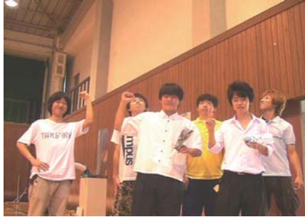
図1 オープンキャンパスでの風景

8月7日(金)に工学部で行われたオープンキャンパスに参加し、体育館で試作機体でのデモフライトを行った。