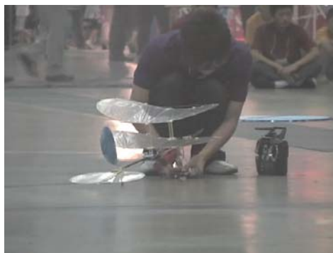
図4 Mr.すみっち号の参加風景