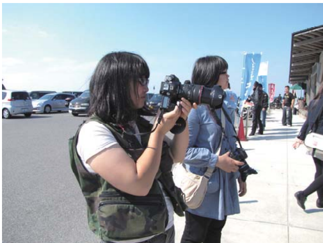
しおかぜの里角島での撮影・聞き込み

また、角島灯台公園、角島砲台跡、牧崎風の公園、角島大橋等の角島の島内や周辺で、撮影を行った。撮影対象として、自然景観、気象、地形等を撮影していった。