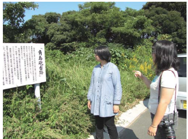
角島砲台跡の取材