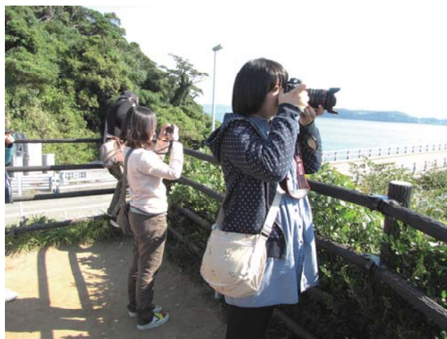
角島大橋、海の撮影風景