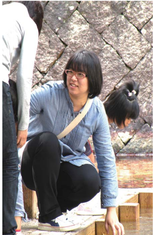
観光客の方とのふれあい