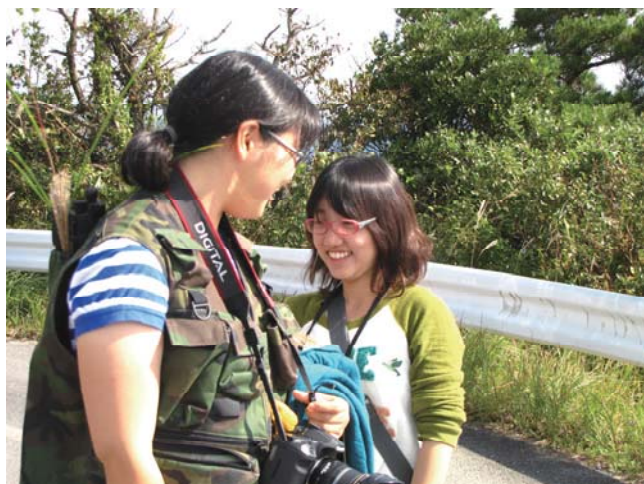
撮影中の打ち合わせ