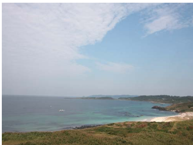
撮影した角島の海