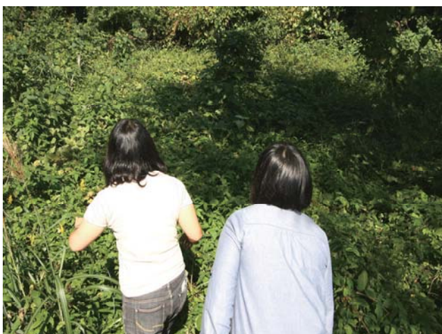
角島砲台跡周辺の調査