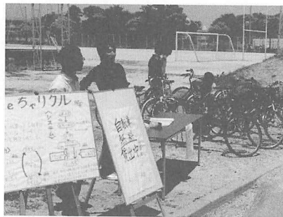
自転車の貸し出しの様子

5月18日（水）に第1回目の自転車貸出をした。当日は昼休憩の時間に工学部福利厚生棟の横で自転車を並べ、ブースを作った。広報としてwebページや学内の掲示板で周知を図った。貸出する際に書類に連絡先や貸出期間などを記入してもらい、デポジットとして2000円を預かった。この日は4台の自転車を貸し出した。その後、貸出を希望する人には連絡をしてもらい貸出をしている。今年度貸し出した自転車は8台である。