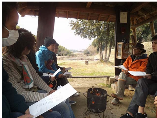
里山ビオトープ二俣瀬にて

3月4日に福岡工業大学のビオトープ研究会6名を山口大学工学部キャンパスへ招待し、夏に行われた交流会から現在までどのような活動を行ったのか、簡単に報告しあった。そして、実際に常盤公園のビオトープ予定地を訪れ、つくった堰や水路の構造などを紹介した。さらに宇部市の里山ビオトープ二俣瀬にてビオトープ研究会の方々と里山ビオトープ二俣瀬を作る会の方々からビオトープで観察できる生き物や外来種、遺伝子汚染の問題や維持管理の苦労話などを伺った。交流会の参加者全員がビオトープや環境について深く学び、考えるよいきっかけとなった。今後も活動報告や意見交換を行うことでお互いの活動がより発展できるように福岡工業大学のビオトープ研究会と交流していく予定である。