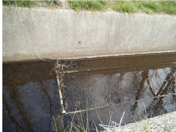
堰の様子 (2月20日撮影)

堰を作った後に台風が数回立て続けに来たため、堰が流されてしまうのではないかと不安があったが定期的に様子を見に行くと、水路の水かさが増しただけで堰は無事であった。堰周辺には多くの落ち葉が堆積しており、植物が根付きやすくなっているのではないかと考えている。