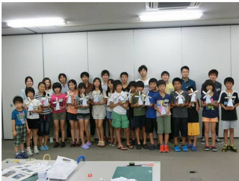
図4 工作教室の様子

イベント終了後、アンケートを行った。子どもを対象にしたアンケートでは、はんだ付けについての感想が一番多く、普段ではできない体験ができたという回答を得た。また、約90パーセントの子どもが、来年も参加したいと希望した。保護者を対象にしたアンケートでは、保護者全員から、「良かった」、「学生がこのような活動を行うことは評価できる」との回答をいただいた。