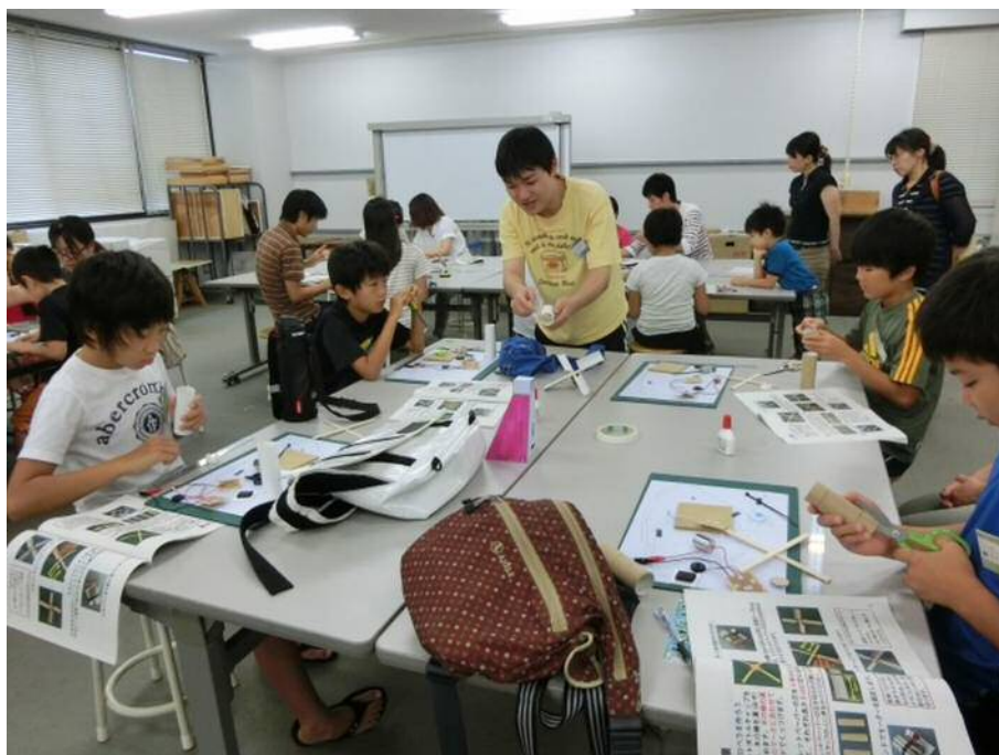
図2 夏休み工作教室