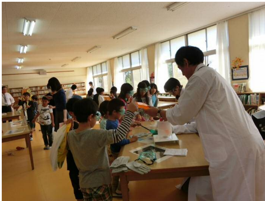
図5 WAKUWAKU フェスタ in 上宇部

幅広い年齢層の地域の方が農業まつりに参加した。その中で私達は子どもを対象としたブースを出展した。ブースでは「バルーン飛行機」と「ストロー飛行機」の工作を行った。いろいろな形の飛行機の製作を通し、子ども達に工作の楽しさや飛行機の不思議を伝えられたと考える。また、地域の方々と協力しイベントを成功させたことで、地域と大学のつながりがより深まったのではと考えられる。